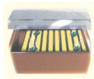
Fig. 4 Richiudere l'arnia e lasciare agire il prodotto per 7 giorni. Ripetere il trattamento per 4 volte con altre strisce e rimuovere gli eventuali residui alla fine del ciclo.