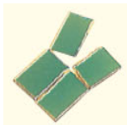
Fig. 2 Prendere una delle strisce e spezzarla in 3-4 parti