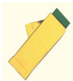
Fig. 1 Aprire il sacchetto appositamente contenente le due strisce.

Non è consigliato l'utilizzo del prodotto in arnie a cassa multipla dove ci si può attendere un'efficacia non sufficiente.